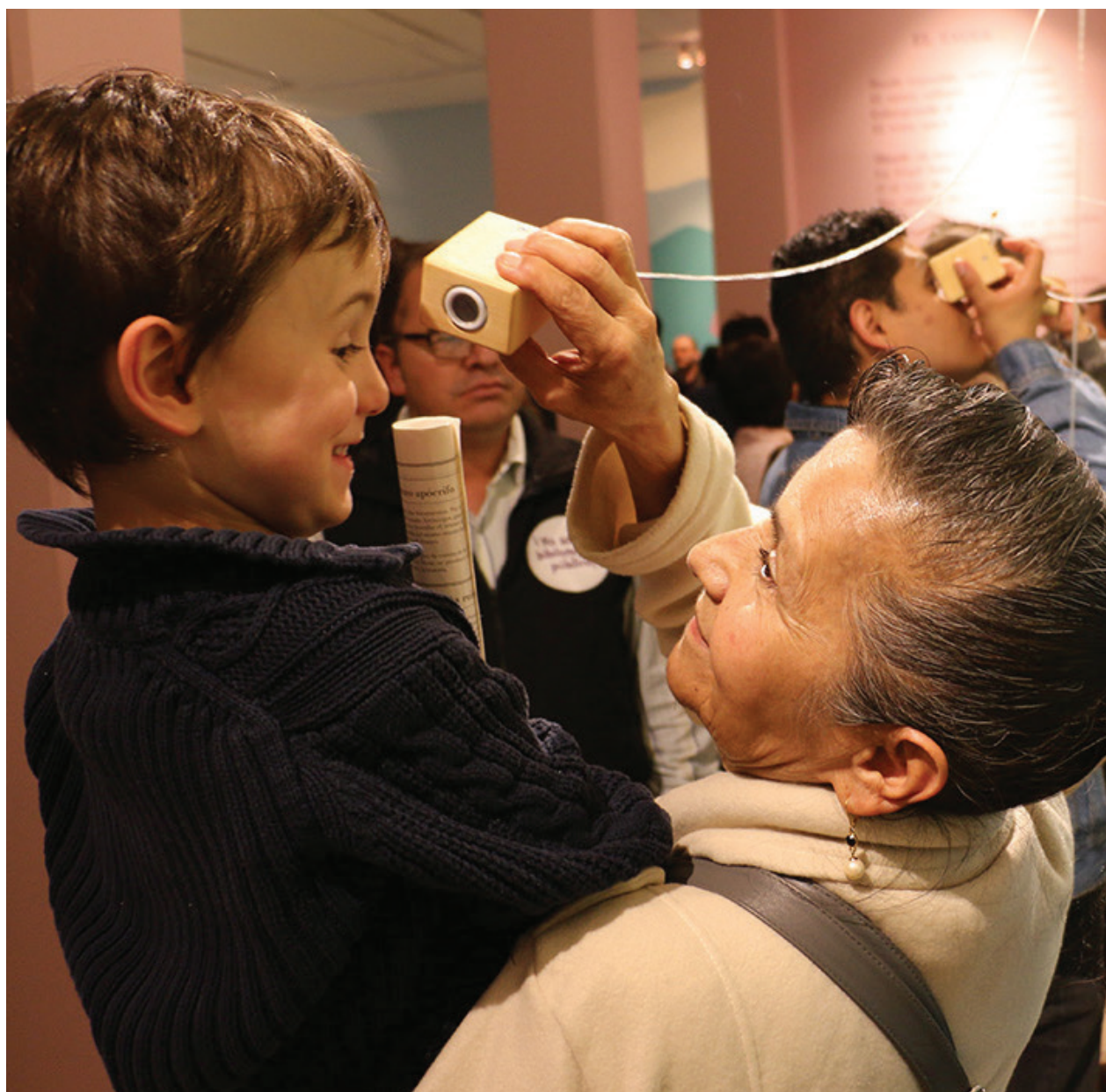
Exposición 'María, el paraíso en contienda', realizada en el marco del Año Jorge Isaacs 2017.

Que la cultura llegue a la mayoría de regiones de nuestra complicada geografía, que a los ciudadanos se les garanticen la lectura y el acceso a las artes, y que se piense en acciones para la apropiación de nuestro patrimonio, no es nada distinto a una aspiración verdaderamente democrática en tiempos de paz.