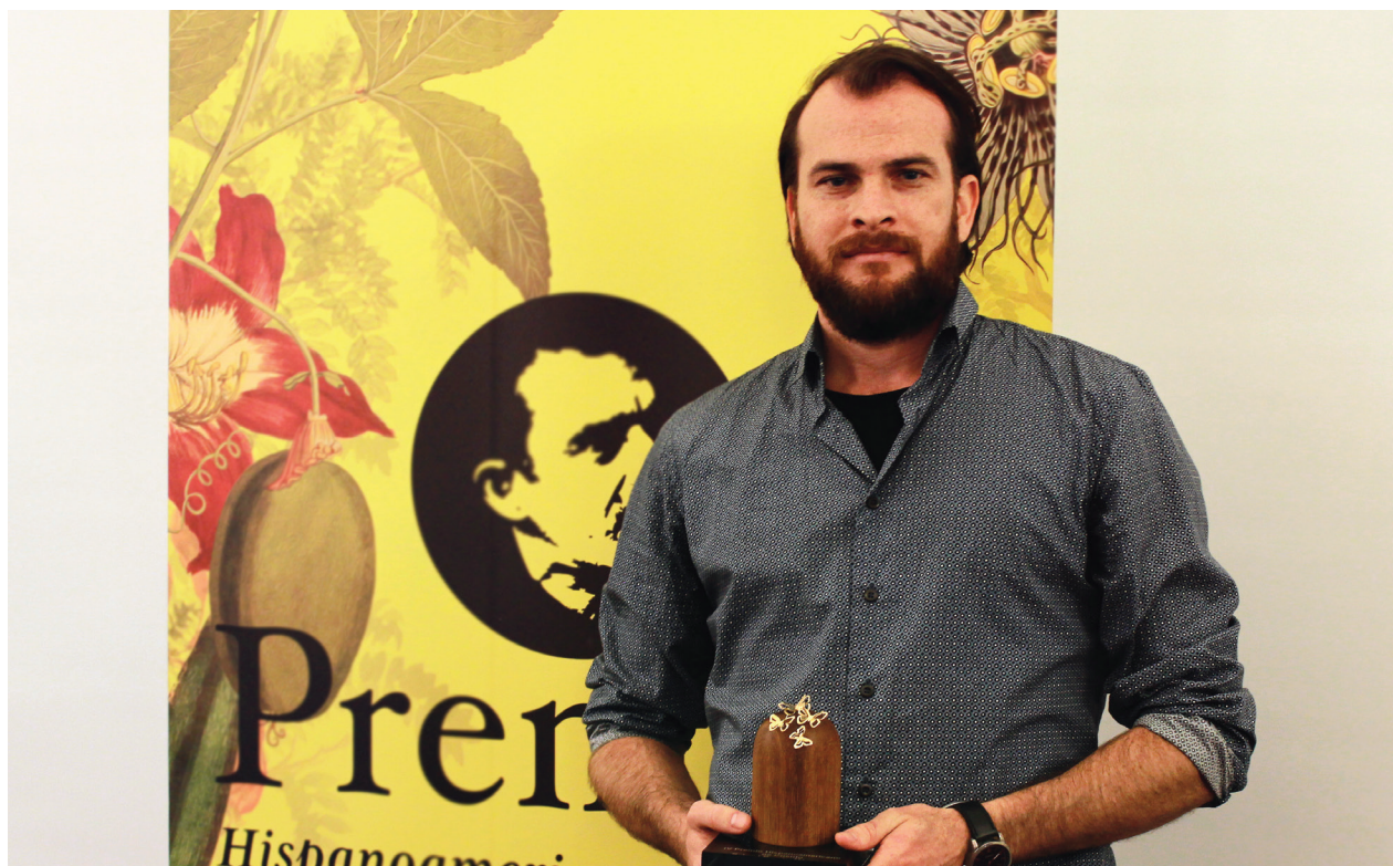
El escritor español Alejandro Morellón Mariano, ganador del Premio Hispanoamericano de Cuento 2017.

Todos estos avances fueron posibles gracias a una inversión histórica del Ministerio de Cultura, lo cual representa una apuesta sin precedentes en el ámbito de las bibliotecas públicas de nuestro país, y al respaldo de diferentes organizaciones de cooperación internacional como la Fundación Bill y Melinda Gates y la Agencia Coreana para la Cooperación Internacional – Koica, las que confiaron en la importancia de las bibliotecas como agentes de transformación para Colombia.