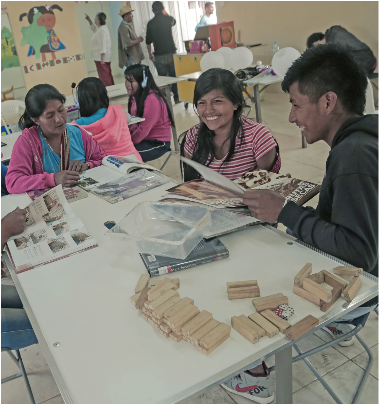
Biblioteca Móvil de la Vereda Andalucía, en Caldoño, Cauca.