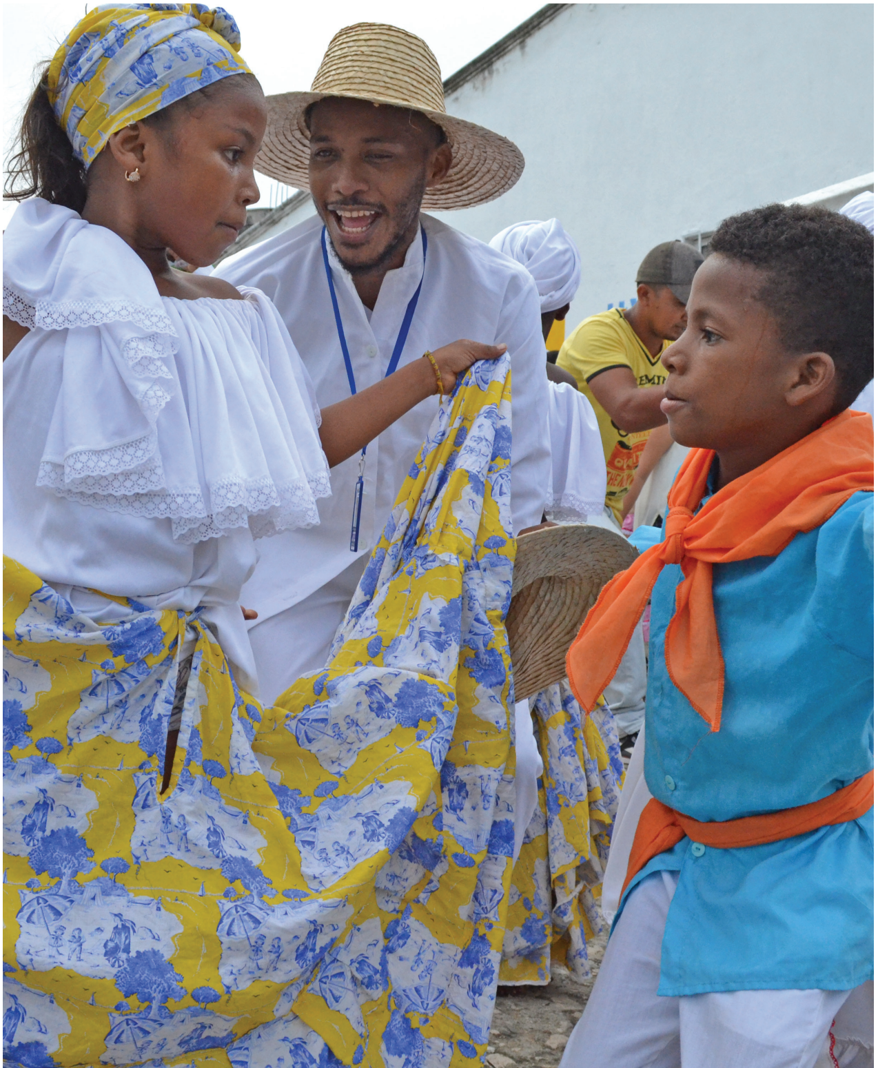
'Expedición sensorial por los Montes de María.'