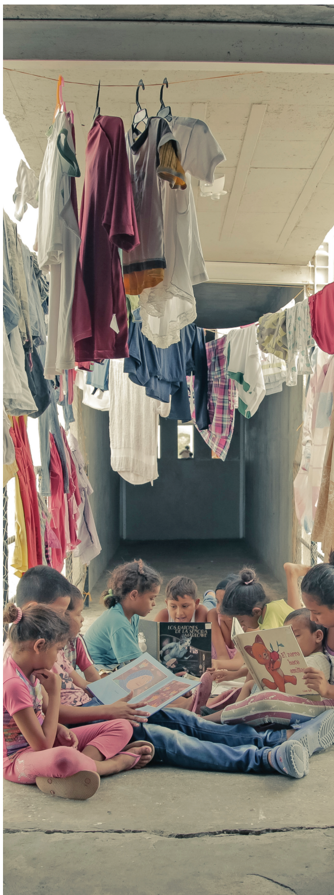
Fomento a la lectura del proyecto 'Comunidad-es', Montería, Córdoba.