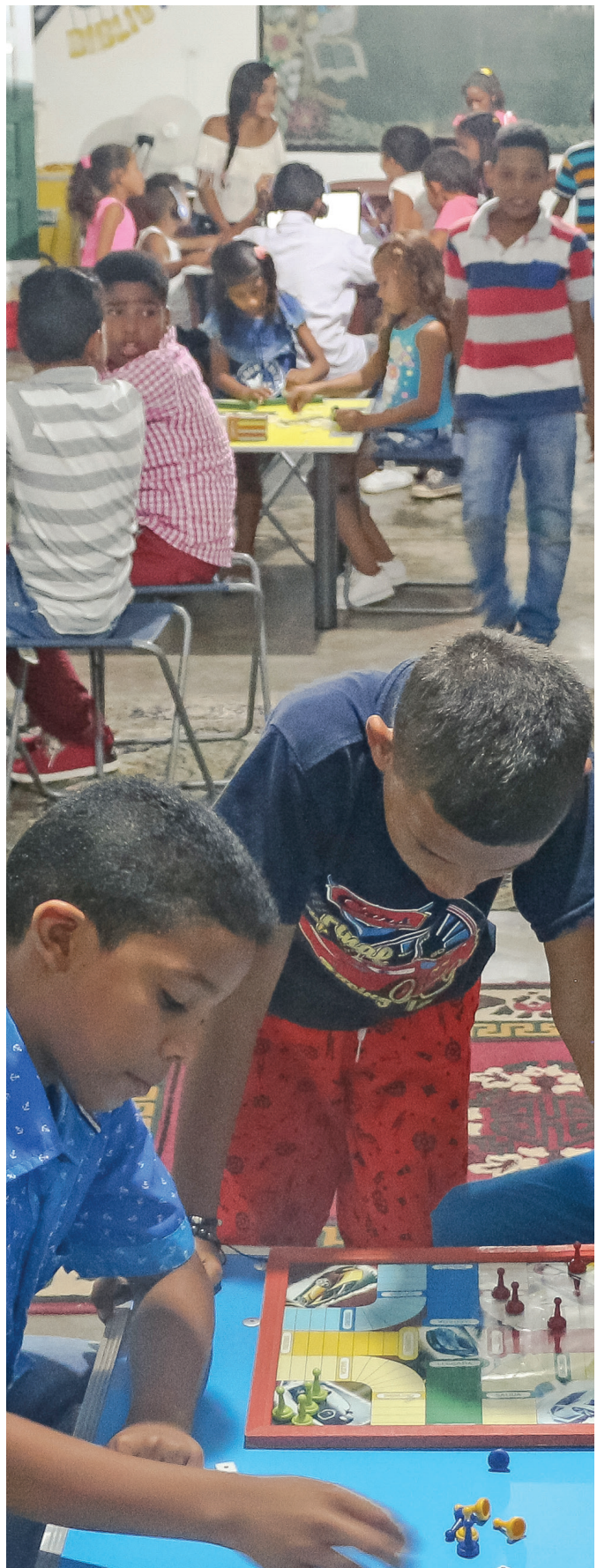
Biblioteca Pública Móvil de Conejo, Fonseca, La Guajira.