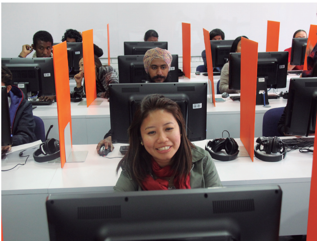
Al finalizar el aprendizaje, el ICC administra el examen Siele, que acredita a los participantes en el manejo de la lengua. Examen Siele, 2017.

Creado en 1942, el Instituto Caro y Cuervo -ICC- es una institución de educación superior -IES- que ofrece programas de maestría y diplomados, impulsa la investigación sobre el patrimonio lingüístico colombiano y socializa el conocimiento producido por su comunidad académica.