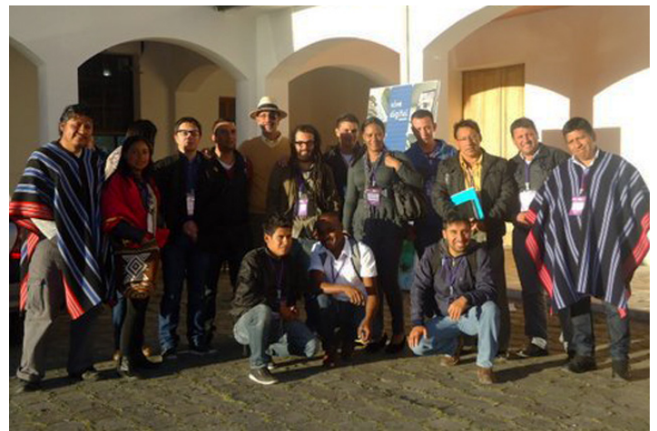
Proceso de Formación / Pasto

El Curso en gestión cultural con énfasis en formulación de proyectos culturales es realizado por la Dirección de Fomento Regional del Ministerio de Cultura, en convenio con la Corporación Promotora de las Comunidades Municipales de Colombia - Procomún.