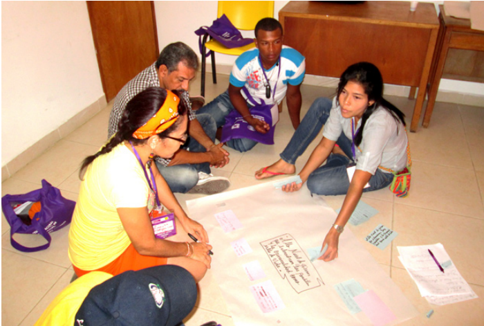
Proceso de Formación / Tolima