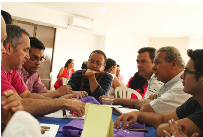
Proceso de Formación / Caicedonia - Valle del Cauca

Agentes del sector cultural con capacidades para la planificación, la gestión y el desarrollo de proyectos e iniciativas culturales, con liderazgo y compromiso con la gestión cultural. Con capacidades para el desenvolvimiento en entornos virtuales (internet, redes sociales, entre otros) y habilidades para la ejecución de actividades en grupo.