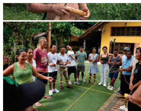
Colaboratorio - Tejer la ancestralidad y los saberes del Guainía - noviembre 2024