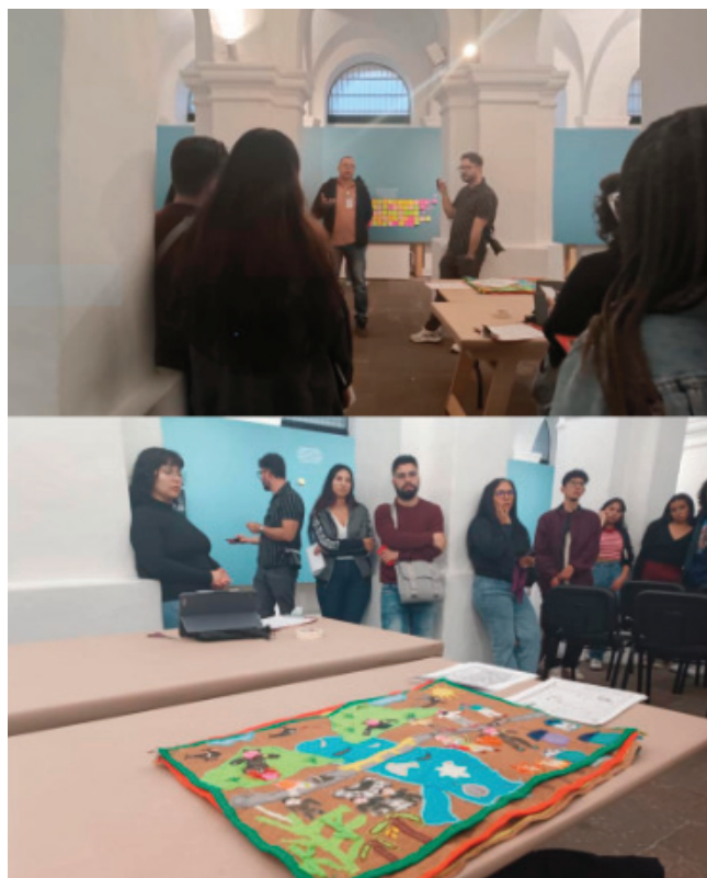
“La violencia en el espacio. Mecanismos y paisajes de necropoder” Eje. Infraestructura y violencia paramilitar.