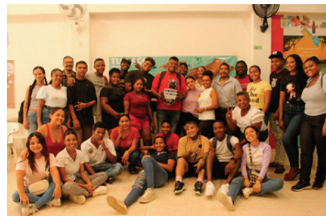
Colaboratorio "Tejiendo raíces, cultura y patrimonio" - Tumaco (Nariño) - junio 2024.