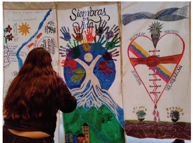
Una víctima cose los pendones realizados por las víctimas y los comparecientes que participaron en el TOAR “Siembras de Vida”. Bogotá, julio 4 de 2024.