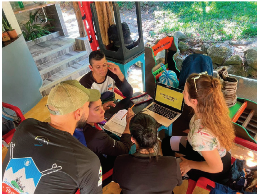
Corporación Social Incluyamos. (2024). Proceso de capacitación [Fotografía]. Colectivo Club Deportivo Remando por la Paz, Caquetá, Colombia.

En septiembre se realizó el laboratorio Colores de Paz y Reconciliación con 20 personas del Espacio Territorial de Capacitación y Reincorporación (ETCR) Georgina Ortiz en el municipio de San Juan de Arama (Meta), quienes aprendieron técnicas de comunicación efectiva, medios digitales y narrativas para la paz. Desde el 12 de octubre, se realizó un laboratorio de creación digital con jóvenes entre los 18 y 28 años de Arauca, Tame, Saravena y Arauquita, en Arauca, este último municipio priorizado con jóvenes firmantes de paz.