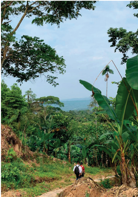
Trabajo de campo.

dinámicas político-económicas regionales que influyen y reconfiguran permanentemente los procesos de construcción del Estado en Putumayo y Caquetá, tales como: La producción de coca. La extracción de petróleo. La expansión del latifundio ganadero. El control de grupos armados ilegales. Las políticas de conservación y restauración ambiental.