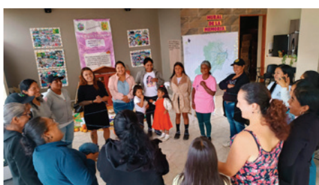
Colaboratorio - "Tejiendo experiencias de mujeres campesinas frente al patrimonio "Parque Arqueológico Tierradentro (Cauca) - junio 2024.