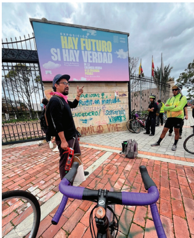
Exposición “La violencia en el espacio. Mecanismos y paisajes de necropoder” Eje Resistencias en lo cotidiano. (2024)