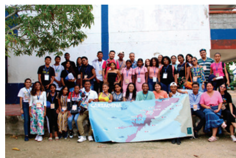
Colaboratorio - Tejiendo Patrimonio: El galeón San José y las comunidades Afrodescendientes - Cartagena, Bolívar - septiembre 2024.