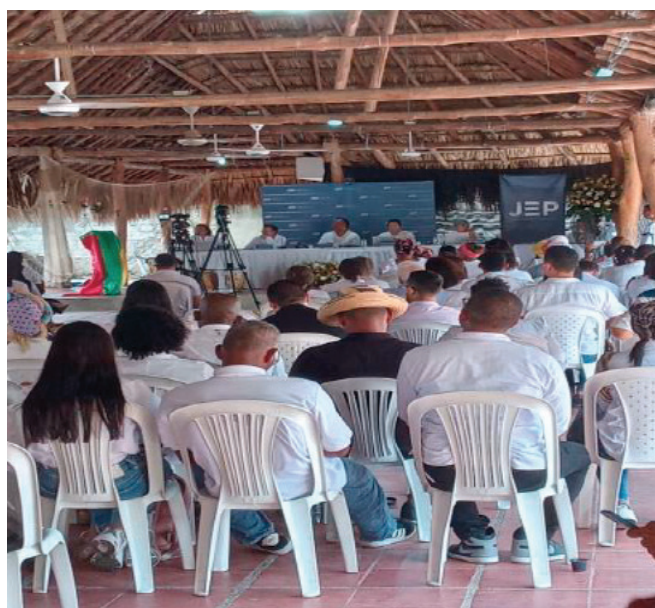
Acto simbólico en el que se presentaron los 3 documentos, entre ellos el "Protocolo Arqueológico Forense para la Búsqueda de Personas Desaparecidas con Enfoque Diferencial Étnico y de Género"

El propósito de estos documentos es contribuir a la resignificación de la región como un espacio de construcción de paz y vida.