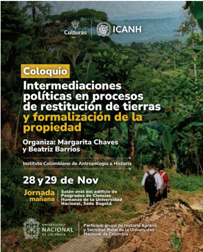
Coloquio Intermediaciones políticas en procesos de restitución de tierras y formalización de propiedad. Diseño ICANH (2024).

El proyecto se encuentra ubicado en el departamento del Putumayo y tiene por objetivo como población atendida comunidades étnicas, indígenas, afrodescendientes y campesinas. La inversión total para este proyecto de investigación fue de $193.329.036