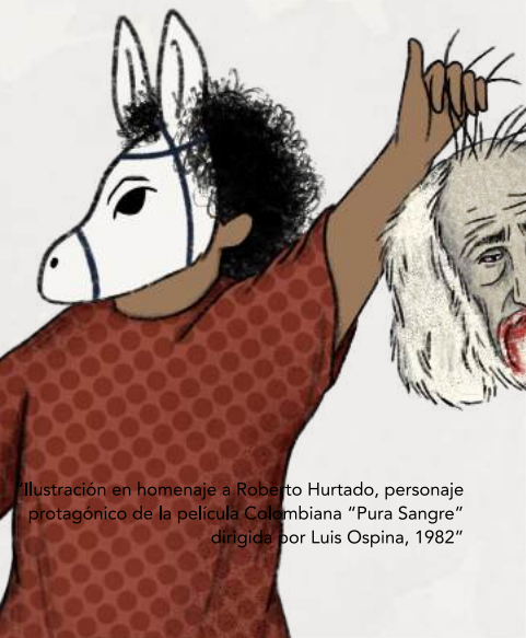
Ilustración en homenaje a Roberto Hurtado, personaje protagonista de la película Colombiana "Pura Sangre" dirigida por Luis Ospina, 1982"

Tener una agenda llena de citas que no tienen que ver puntualmente con el cine de terror. Agotador y sin resultados útiles.