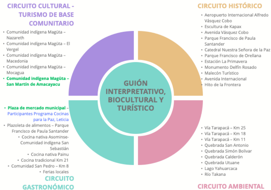
Gráfica 1. Identificación comunidades para la activación ruta de turismo cultural en el marco del Guion Interpretativo, biocultural y turístico