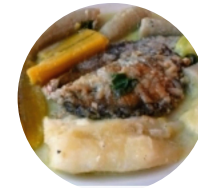
Rondón Friend fish

Al hacerlo, no solo preservamos la diversidad alimentaria de la región, sino que garantizamos que las nuevas generaciones valoren su rica herencia gastronómica.