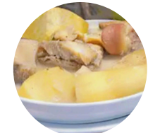
Rondón Fresh Fish