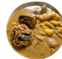
Rondón Roast Fish