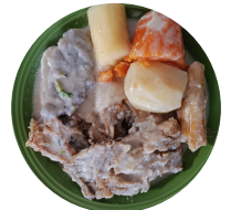
Rondón Salted fish