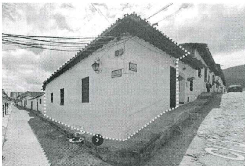
Ilustración 1 Predio identificado con la dirección "Calle 31 24 05" antes de la intervención. Marzo de 2023.

La Dirección de Patrimonio y Memoria del Ministerio de las Culturas, las Artes y los Saberes, recibió su comunicación con número de radicado MC03158I2024 del 02 de septiembre de 2024, por medio de la cual, solicita el apoyo técnico de este despacho, en el marco de la averiguación preliminar AP 2024-0053 iniciada por la intervención no autorizada en el inmueble identificado con la dirección Calle 31 24 05, localizado en el Centro Histórico de Girón, Santander.