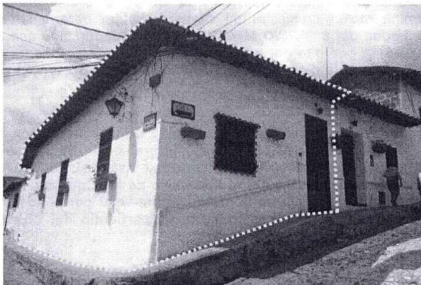
Ilustración 2 Predio identificado con la dirección “Calle 31 24 05” después de la intervención. En rojo se observa la intervención correspondiente a la apertura de una nueva ventana en fachada. Octubre de 2024.

“Por medio del cual se ordena el cierre de la etapa de averiguación preliminar AP 2024-0053 la apertura de proceso administrativo sancionatorio”