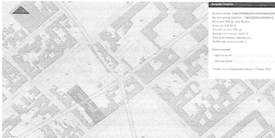
(Número 0004 : con frentes sobre la plaza principal -carrera 10 de por medio, abajo-)