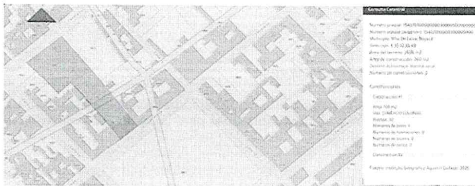
(Número 0005 ; con frentes sobre la plaza principal -carrera 10 de por medio, abajo-, y la carrera 11-arriba-)