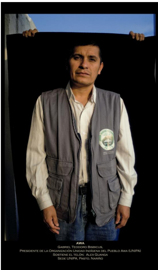
AWA GABRIEL TEODORO BISRICUS, PRESIDENTE DE LA ORGANIZACIÓN UNIDAD INDÍGENA DEL PUEBLO AWA (UNIPA) SOSTIENE EL TELÓN: ALEX GUANGA SEDE UNIPA, PASTO, NARIÑO

El Plan de Vida del pueblo Awá contiene los objetivos, proyectos y “plataforma de lucha” (UNIPA, 2008:13-14), y sus mecanismos de participación, en el que se propone: el fortalecimiento de la autoridad y ejercicio de la autonomía; la promoción y consolidación del proceso socio-organizativo y unidad en la diversidad multiétnica y pluricultural; la defensa del territorio y conservación de la naturaleza; el cumplimiento del Plan de Ordenamiento Ambiental y Cultural del Territorio Awa y actualización permanente del mismo; la recuperación y fortalecimiento de la producción y economía propia; la exigencia de la aplicación de la educación bilingüe e intercultural como principio para el fortalecimiento de la identidad; fortalecimiento e impulso de la medicina tradicional y la salud integral; el fortalecimiento de historias y tradiciones que permitan conservar el núcleo familiar.