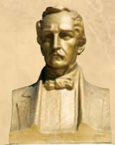
Francisco de Paula de Santander, Tame.

El ejército patriota descansó esa noche en Ventaquemada donde el General Soublette firmó el parte de victoria. El 8 de agosto emprendieron la marcha hacia Santa Fe, pasando por Villapinzón, Chocontá, Suesca, Nemocón, Zipaquirá y Cajicá. El 10 de agosto Bolívar pasó por el Puente del Común y en la tarde entró triunfante a Santa Fe. Comienza entonces el trabajo de consolidar la victoria y organizar un gobierno republicano.