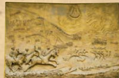
Placa conmemorativa, Tutazá