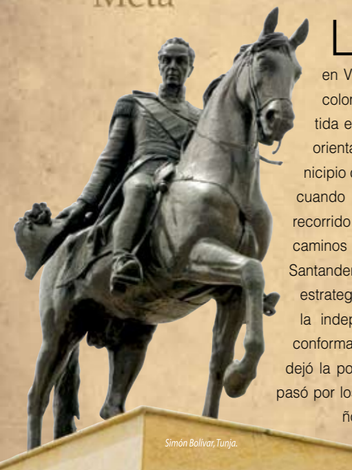
Simón Bolívar, Tunja.