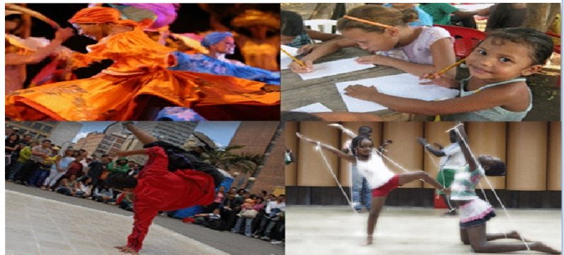
IMAGEN DEL PROYECTO