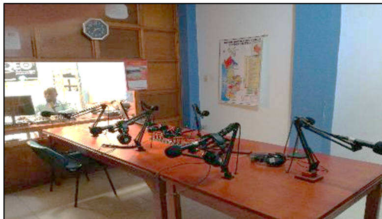
Sala de grabación de Canaleta Estéreo.