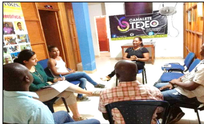
Entrevista con el equipo de Canalete Estéreo, Istmina.

Una vez obtenida la licencia para la Fundación Canalete, lo complicado fue suplir la necesidad de equipos y de un lugar adecuado para su funcionamiento, además de tener que aprender cuál era la estructura de una radio comunitaria. Dado que el único referente era la emisora Brisas del San Juan , afiliada a RCN, el Ministerio de Comunicaciones inició un proceso de capacitación. El haber resultado ganadores del premio Procomún Eternit, Luis Carlos Galán (1999) fue de gran ayuda e impulso, al quedar de terceros a nivel nacional y finalistas en la zona Pacífico. El premio consistió en la dotación de equipos básicos y elementos de información y educación.