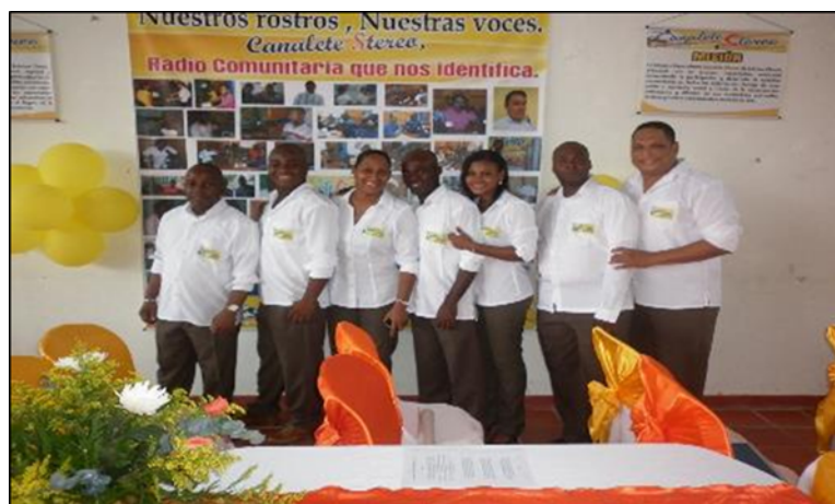
Equipo humano Canalete Estéreo en evento