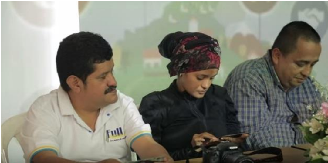
video informativo del evento