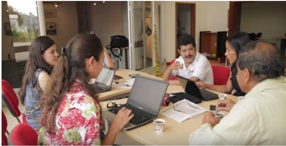
Registro Fotográfico del Ministerio de Cultura, video informativo del evento