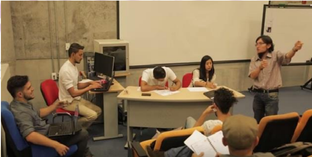
video informativo del evento