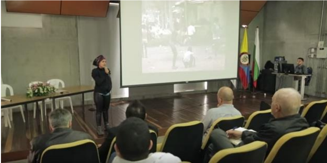
Registro Fotográfico del Ministerio de Cultura, video informativo del evento

“Queremos narrar otro tipo de ciudad en que se visibilice el trabajo de los líderes comunitarios, visibilizar los territorios de la memoria de las personas desplazadas del pacífico, las cuales traen cierto tipo de prácticas, experiencias y formas de vida”.