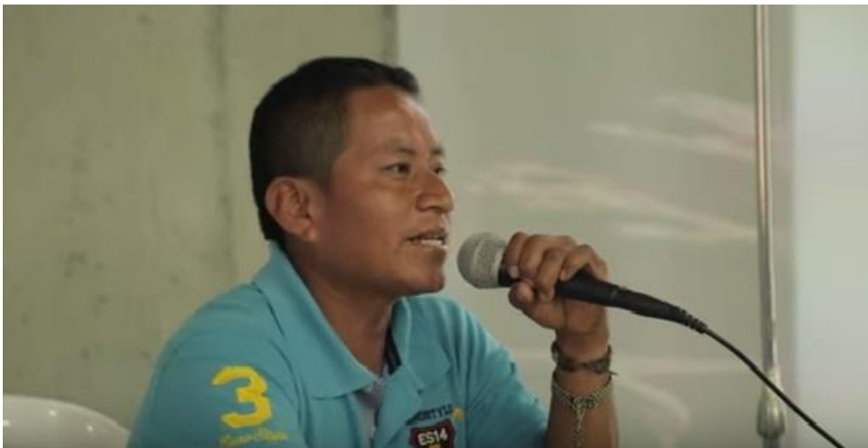
Registro Fotográfico del Ministerio de Cultura, video informativo del evento

“La muerte nos duele igual, de los Colombianos, de los soldados... uno ve con mucha preocupación que para los medios masivos de comunicación la muerte se volvió noticia, porque tiene que haber sangre para que sea noticia... ¿qué está haciendo la comunicación?”.