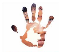
Cartografía de la Diversidad