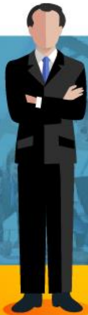
JEFE DE LA ENTIDAD