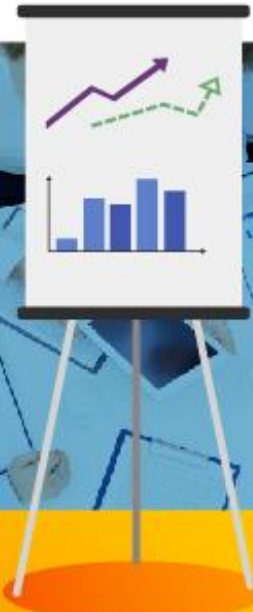
JEFE DE OFICINA DE PLANEACIÓN