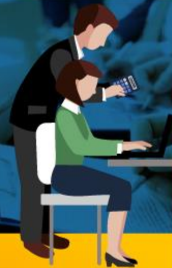
EVALUADOS Y EVALUADORES