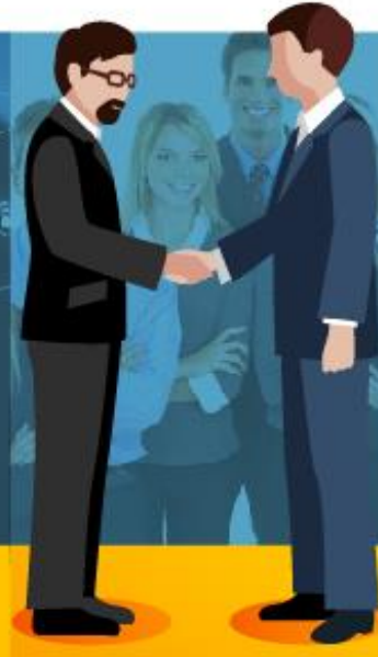
JEFE DE LA UNIDAD DE PERSONAL