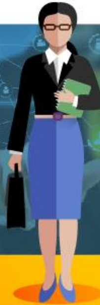
JEFE DE OFICINA CONTROL INTERNO